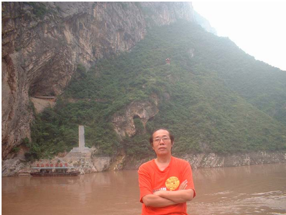
登神女峰旅游的小码头

我这是第三次进三峡：第一次是 1989 年长江日报做东召开全国报纸新闻评论讨论会，我以工作人员的身份上船，游览了当时刚刚“面市”的小三峡。因为北京局势微妙，当时在船的