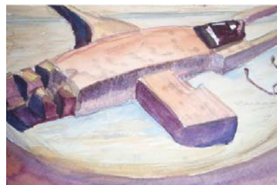
pentraĵo de la aŭtorino

Do fidu ke pliboniĝos. La mondo pli bona iĝos.