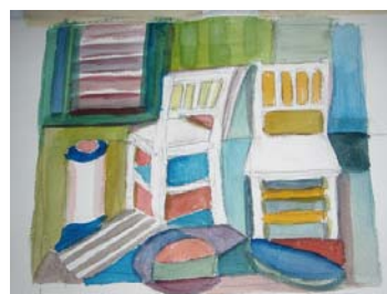
penraĵo de la aŭtorino

Preni paperon kaj penikojn kaj fantazie krei meblojn, seĝojn, bretarojn — tre facile estas kaj laŭdon ne forestas. Vian surskribon surbilde estas.