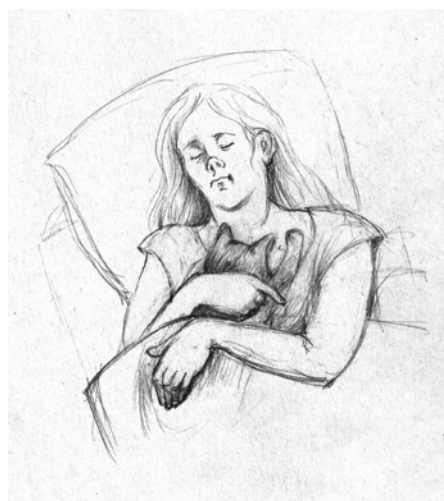
Ilustraĵo de Tatjana Ĥomjakova

Kaj Nina vere vidis la katinon ĉiufoje, kiam ŝi malfermis la pordon. Ŝi ĵetis siajn sakojn kaj antaŭ ĉio prenis Floron en siajn brakojn. Kaj tiel estis ĉiutage, dum multaj tagoj, multaj monatoj. Nina ne maltrankviliĝis, ke jam tiel longe ŝi estas infane alligita al la animalo, ke en sia vivo neniu plu serĉas, nek bezonas. Ŝi simple neunufoje pensis, ke homoj ne povas esti tiaj kiel animaloj — simple ami, sendepende de io.